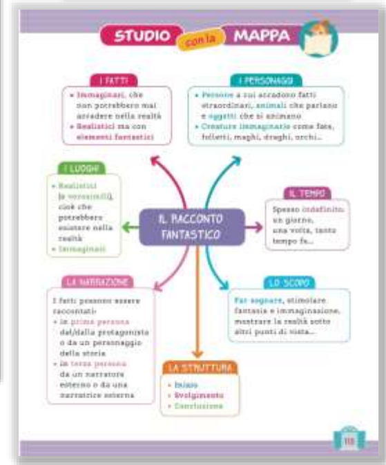
mappa per il ripasso in chiusura unità